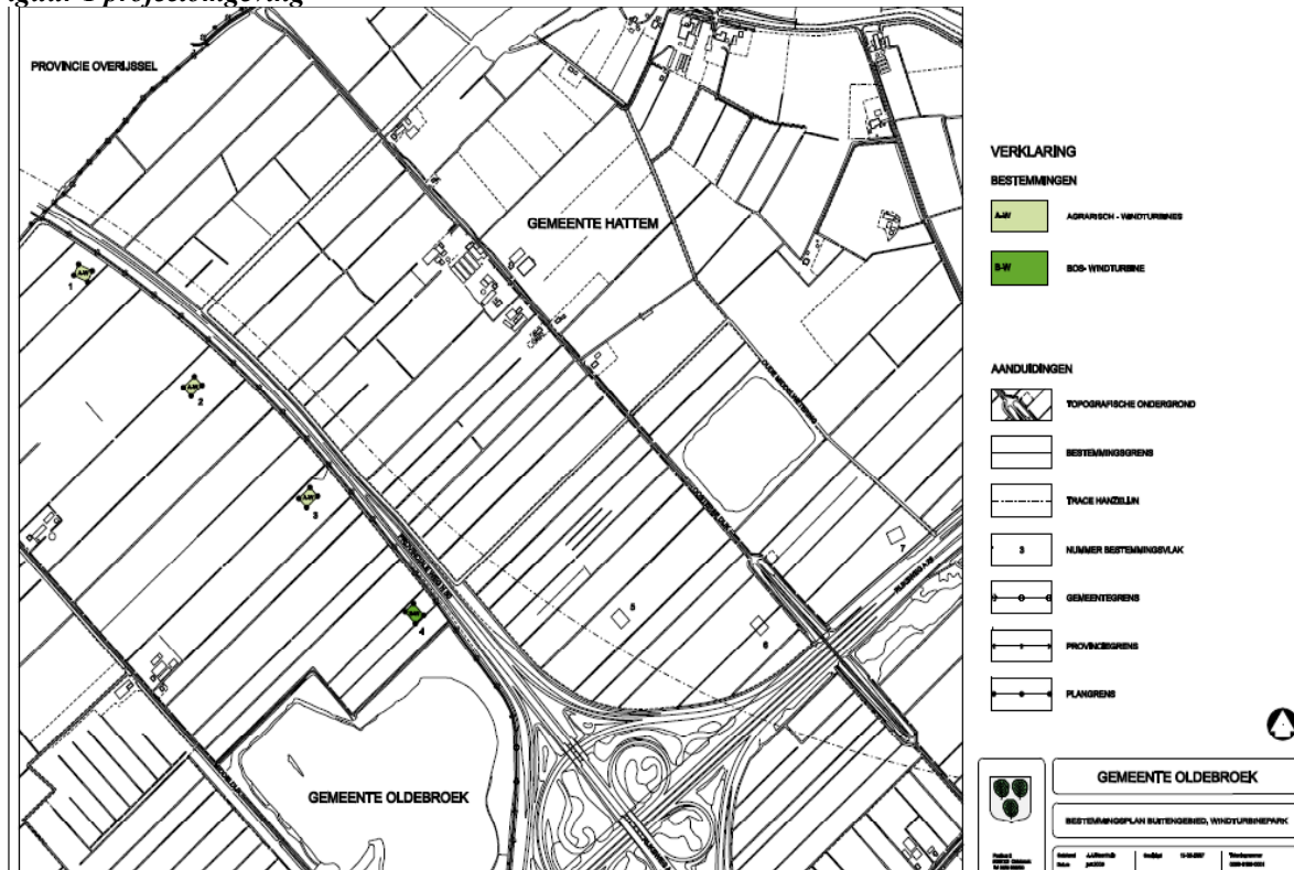
Figuur 1 projectomgeving

Voor wat betreft het windenergieproject gaat het nog steeds om hetzelfde plan als waardoor de Afdeling Bestuursrechtspraak Raad van State een streep heeft gezet wegens het ontbreken van een PlanMer. In figuur 1 wordt de projectomgeving weergegeven.