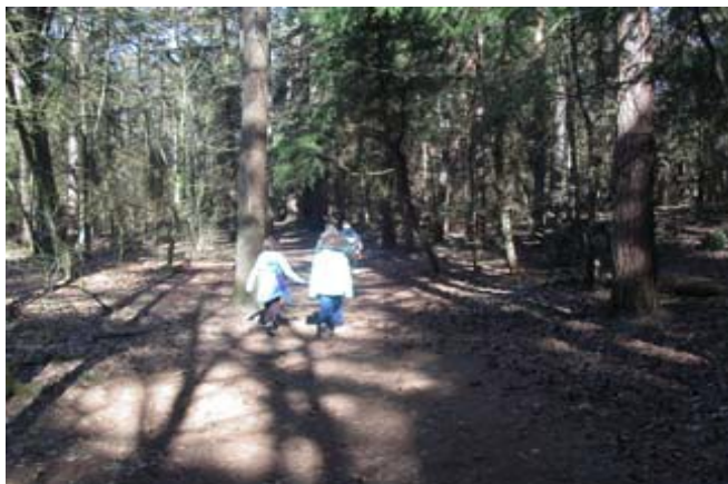
Ruimte om te spelen in een natuurlijke omgeving.

Dat hebben we gedaan op verschillende manieren. Eén moment was tijdens de leerlingenraad waarbij kinderen uit groep 7 en/of 8 naar het gemeentehuis komen. En wat blijkt: Eigenlijk zijn de kinderen nog steeds kinderen die het liefst zelf willen weten wat ze wanneer en waar willen doen. Misschien moeten wij veranderen. Beetje terug naar vroeger, beetje terug naar Natuurlijk Spelen!