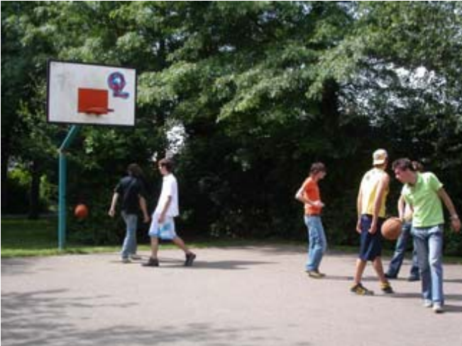
Elkaar ontmoeten en samen sporten kan op een basketbalveldje