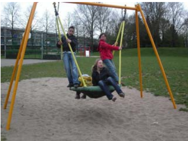
Een vogelnestschommel is een voorbeeld van een speeltoestel dat ook voor de doelgroep met een beperking geschikt is.

Verzoeken van wijkverenigingen en buurtbewoners, worden getoetst aan de eisen van het attractiebesluit en daarbij zoveel mogelijk gekoppeld aan de onderhouds- en vervangingscyclus. Wij zijn echter bereid om bij bewonersinitiatieven de grenzen op te zoeken van wat wettelijk is toegestaan.