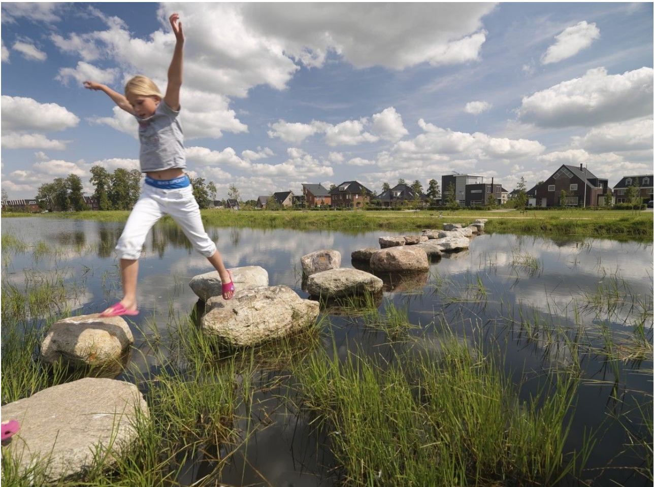
Stapstenen in Oostindie