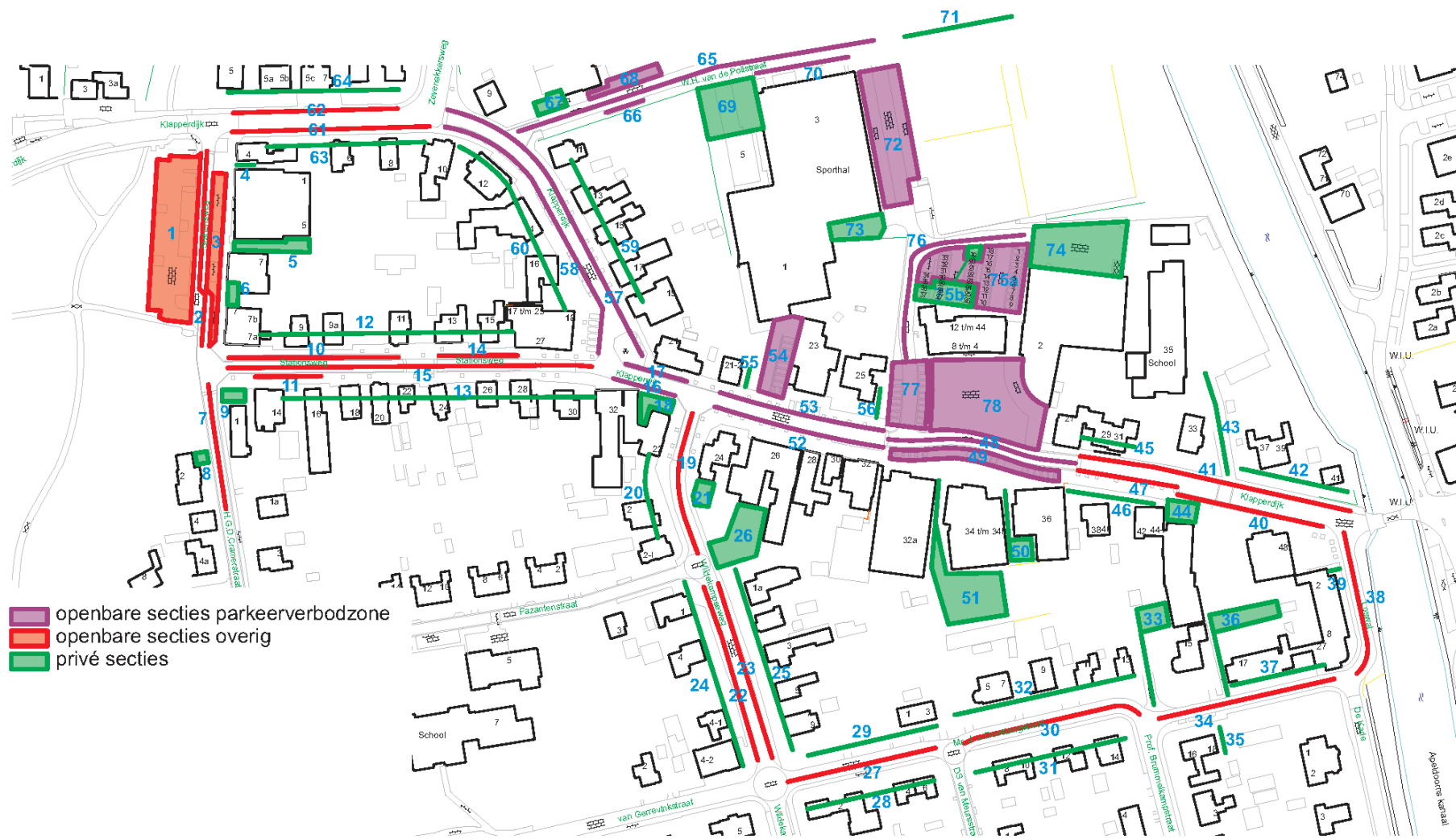
Figuur 2: Secties parkeeronderzoek centrum Wapenveld